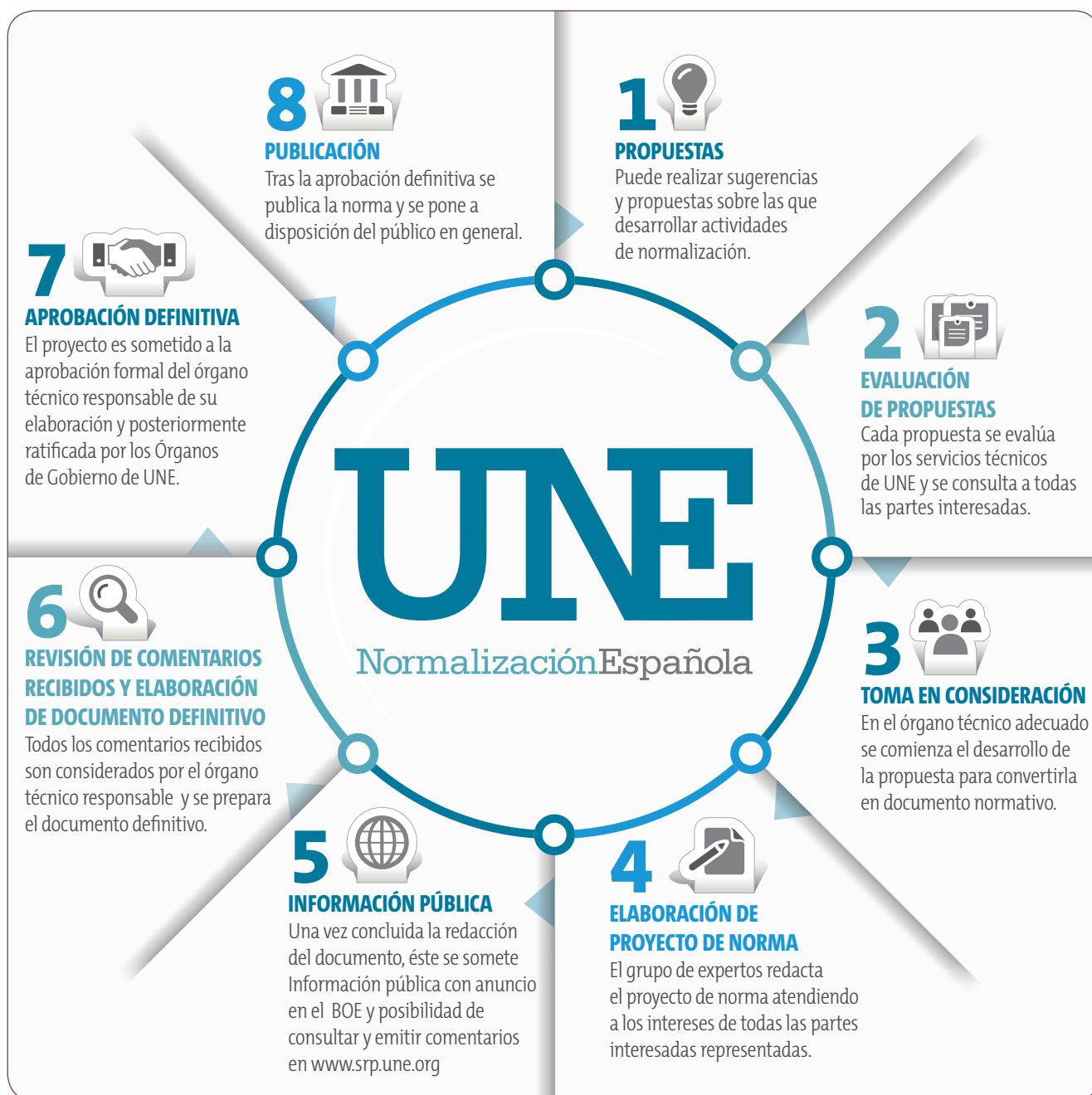
Figura 5: Proceso de elaboración de las normas UNE

de Normalización (CTN) de UNE, que están abiertos a la participación de todas las partes interesadas para potenciar un debate plural. Las decisiones se toman siempre bajo unas condiciones de consenso muy exigentes, garantía de imparcialidad -dos tercios para los proyectos de norma- y los documentos son sometidos a un periodo de información pública en BOE, accesible en la web de UNE. Todos estos factores aseguran la transparencia en el desarrollo de las normas y que se ha llegado a la mejor solución técnicamente posible.