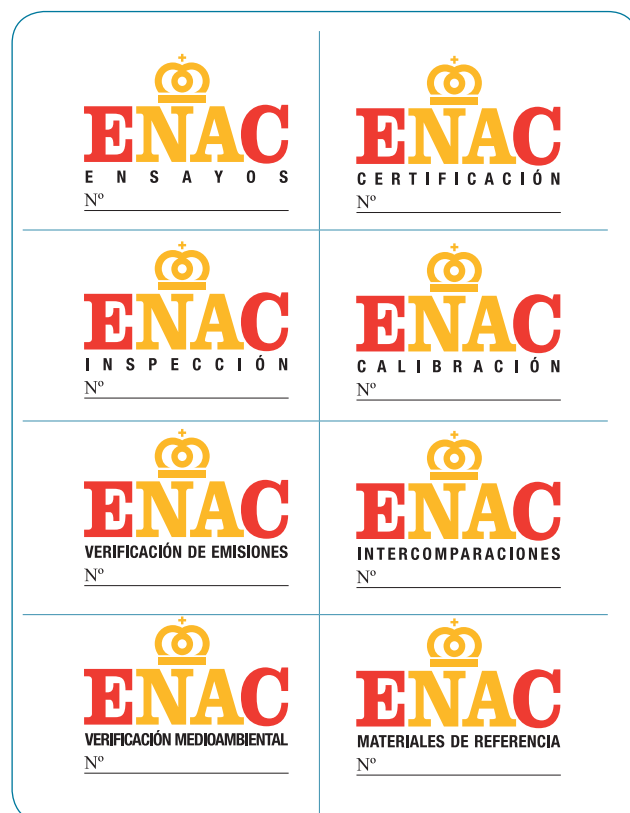
Marcas de acreditación para las diferentes actividades de evaluación de la conformidad

Por tanto, la actividad acreditada es únicamente la que se desarrolla dentro del alcance de acreditación, motivo por el que es necesario saber cómo identificar las actividades acreditadas.