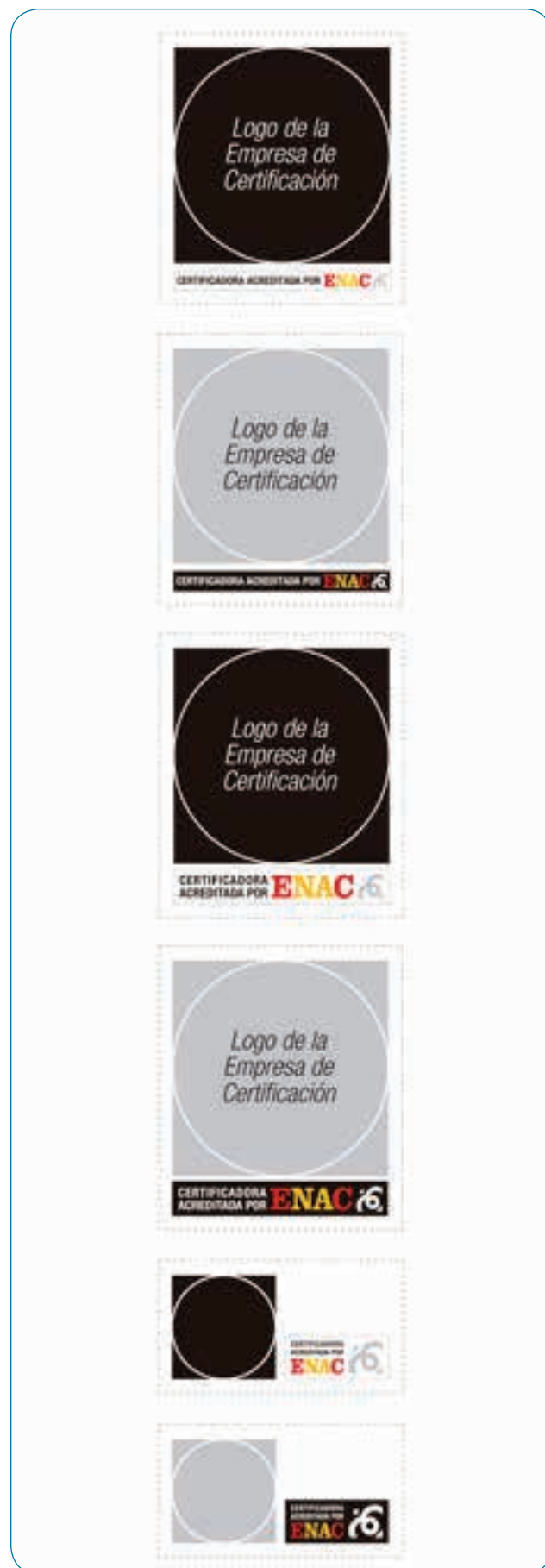
Ejemplos de las Marcas de certificación acreditada por ENAC

Adicionalmente, ENAC permite a las entidades de certificación hacer uso de una “marca de certificación acreditada” (MCA). Que un producto lleve una MCA es una demostración de que el certificador que la ha concedido controla su uso y está acreditado por ENAC, pero no que la certificación se haya concedido con referencia a normas por lo que, en cualquier caso, el licitador debería presentar el correspondiente certificado en vigor.