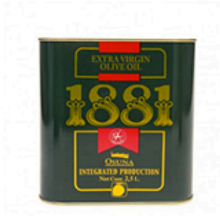
Aceite Oliva 1881