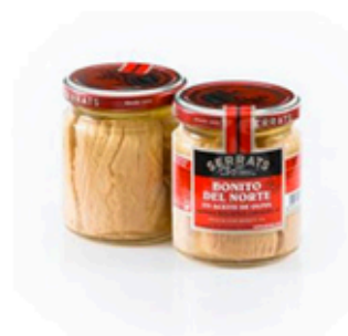
Bonito del Norte Aceite Oliva