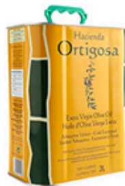
Aceite Oliva Hacienda Ortigosa