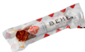
Chorizo Ibérico Bellota