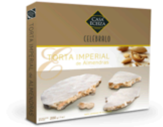
Turrón Torta Imperial