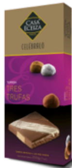
Turrón Tres Trufas