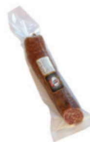
Salchichón Ibérico Bellota