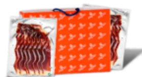
Paleta Ibérica Bellota Fileteada