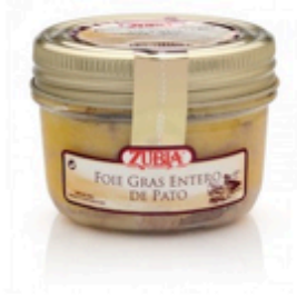
Foie de pato Zubia