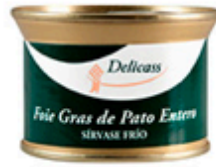
Foie de pato Delicass