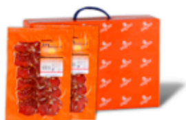
Lomo Ibérico Fileteado