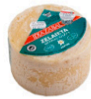
Quedo Idiazabal de Orendain