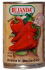
Pimientos Piquillo Extra