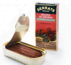
Anchoas Aceite de Oliva