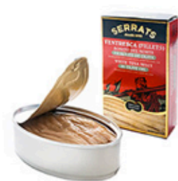
Ventresca de Bonito Aceite Oliva