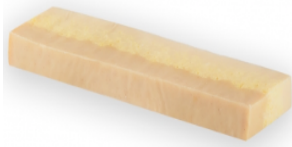
Turrón Arroz con leche