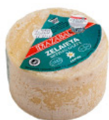
Queso Idiazabal de Orendain