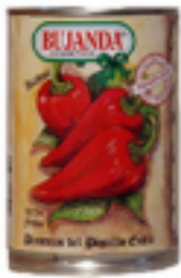
Pimientos piquillo Extra