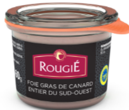
Foie de pato Rougié