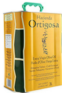
Aceite Oliva Hacienda Ortigosa