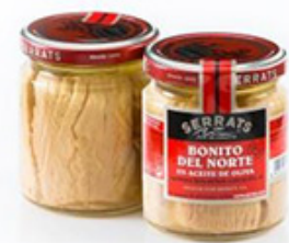
Bonito del Norte Aceite Oliva