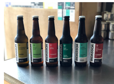
Cervezas Artesanas Cerveza 33cl