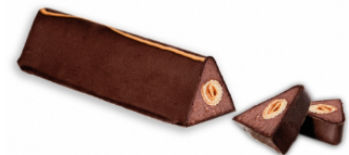
Turrón Tejas y cigarrillos