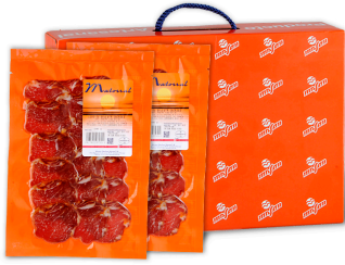
Lomo Iberico Fileteado