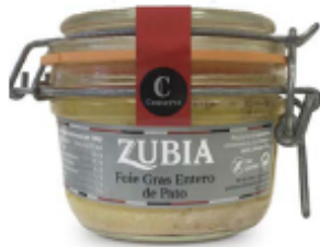
Foie de pato Zubia