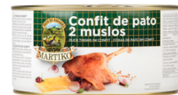
Confit de pato Martiko