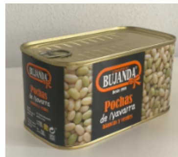
Pochas Blancas y verdes