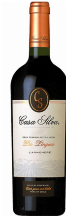
Casa Silva Los Lingues Carmenere Chile