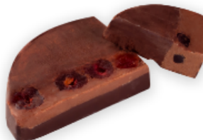
Turrón Chocolate intenso al Armañac