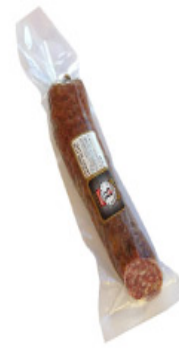
Salchichón Iberico Bellota