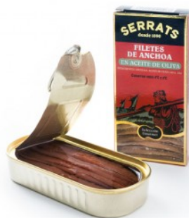
Anchoas Aceite Oliva