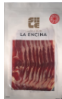
Paleta Iberica Bellota Fileteado