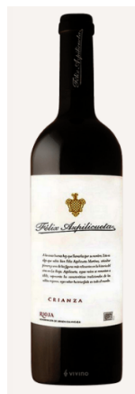
Felix Azpilicueta Crianza