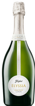
Elyssia Gran Cuvée Cava