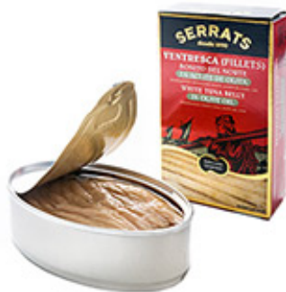
Ventresca Bonito Aceite Oliva