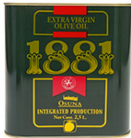
Aceite Oliva 1881