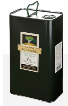
Acetie Campos Monjardin AOVE 4,2 / 5