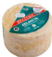
Queso Idiazabal de Orendain