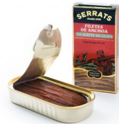
Anchoas Aceite Oliva 4,5 / 5