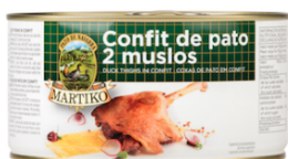
Confit de pato