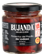
Bujanda Pimientos del Picuillo Extra