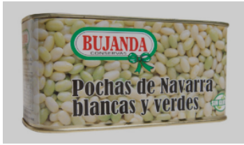
Pochas Verdes y blancas 4,4 / 5