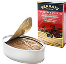
Ventresca Bonito Aceite Oliva 4,8 / 5