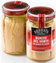
Bonito del Norte Aceite Oliva 4,5 / 5