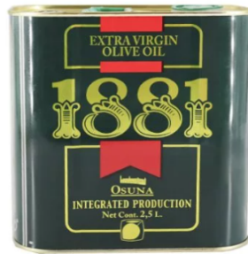
Aceite 1881 AOVE 4,4 / 5