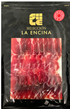
Paleta Iberica Bellota Fileteado 4,4 / 5