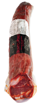
Chorizo Iberico Bellota 4,0 / 5