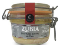
Foie de pato