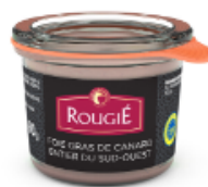
Foie de pato