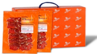
Lomo Fileteado 4,4 / 5